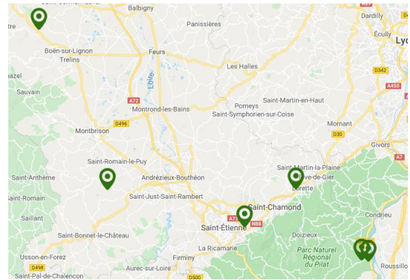
Carte : Nids de frelon asiatique détruits sur le département de la Loire en 2019

Les conditions climatiques de l'année semblent avoir été défavorables au prédateur. Malgré tout, le frelon asiatique continue sa progression.